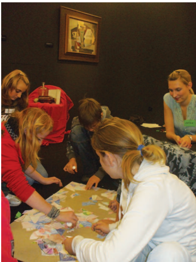
Edukační oddělení: animační program na výstavě Kubismus 1910–1925 ve sbírkách Západočeské galerie v Plzni.