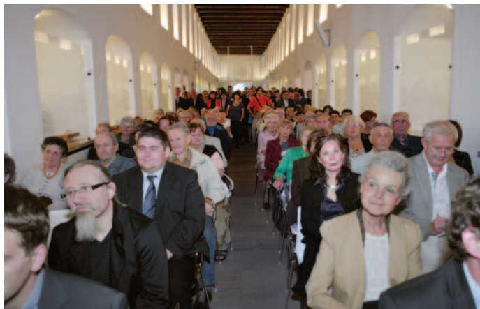
Slavnostní otevření výstavních sálů Masné krámy a „13“ po rekonstrukci, Masné krámy, 8. října 2009.