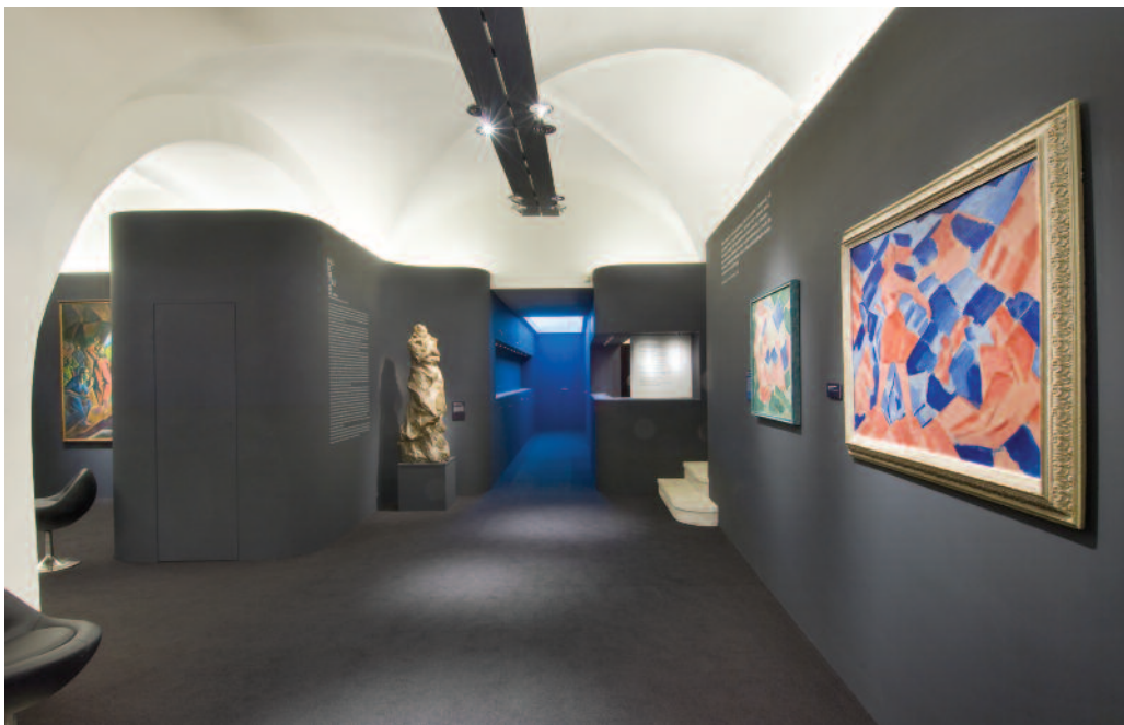
Pohledy do expozice výstavy Kubismus 1910–1925 ve sbírkách Západočeské galerie v Plzni v nově rekonstruovaném prostoru výstavní síně „13“.