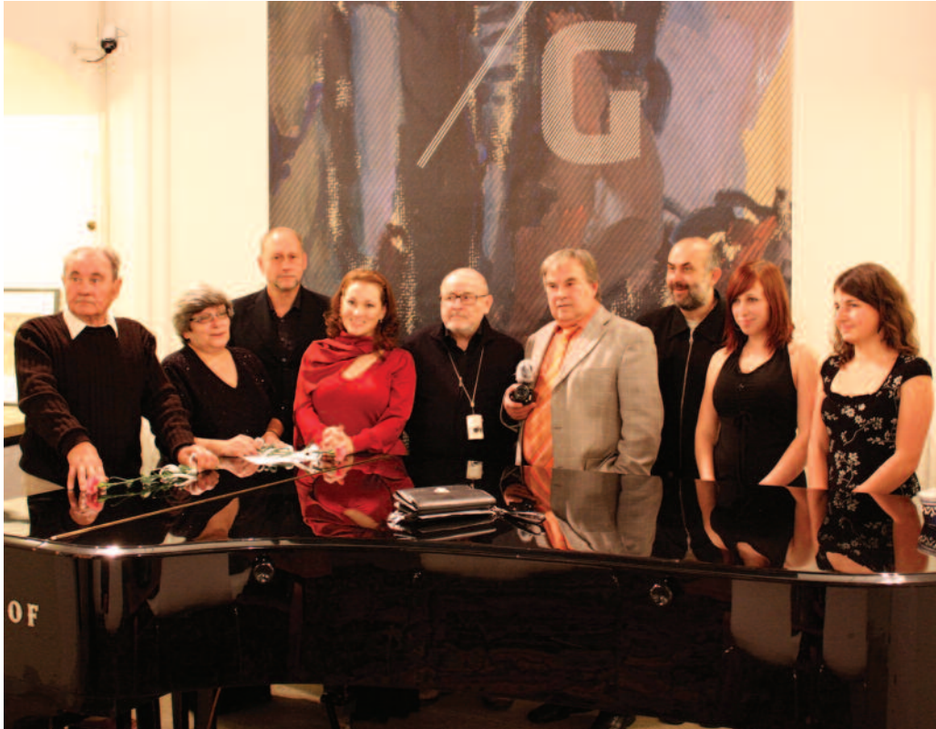
Programové oddělení: kulturní program z řady „herecká setkání“ v rámci výstavy Jan Autengruber (1887–1920).