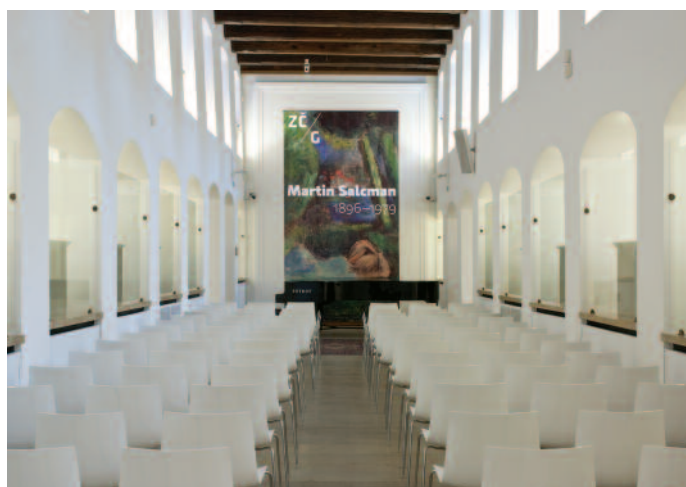
Pohled do střední lodě výstavní síň Masné krámy po rekonstrukci.