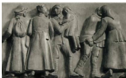
část vlysu Návrat legii pro Legiobanku v Praze 1921–1922 Národní galerie v Praze