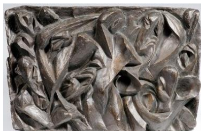
Koncert 1912–1913 Západočeská galerie v Plzni

Výstava vznikla ve spolupráci Západočeské galerie, která má ve svých sbírkách významná sochařská díla, s Museem Kampa , kde je uložena Gutfreundova pozůstalost. Několik zásadních děl je zapůjčeno z dalších sbírek (Národní galerie v Praze, Moravská galerie v Brně, Židovské muzeum v Praze, soukromá sbírka). Na výstavě jsou prezentovány téměř dvě desítky soch a více než tři desítky kreseb , dále dobové fotografie a katalogy a také Gutfreundovy skicáky. Západočeská galerie spravuje početnou kolekci Gutfreundových plastik získanou v různých časových obdobích a z různých zdrojů, a to včetně umělcevy rodiny či přátel. Zajímavá je například akvizice Masky s náhrdelníkem (1920), kterou získala ZČG v roce 1968 z majetku V. V. Štecha.