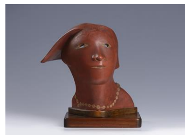
Maska s náhrdelníkem 1920 Západočeská galerie v Plzni

K výstavě vydává ZČG stejnojmennou publikaci .