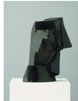
Hlava ženy 1919 Muzeum umění Olomouc