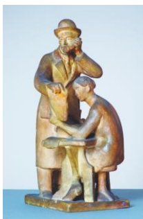
Obchod 1923 Severočeská galerie výtvarného umění v Litoměřicích